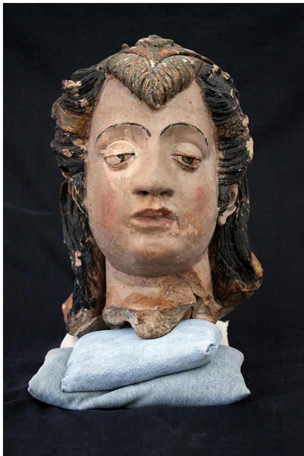
Cabeça de busto relicário, após o tratamento.