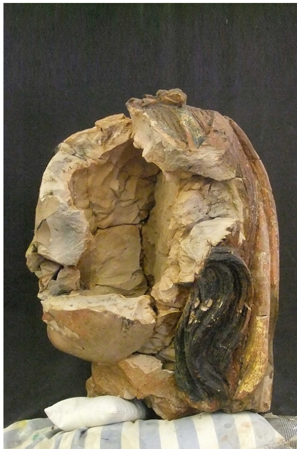
Durante o tratamento: descolagem dos fragmentos; preenchimento e reconstituição volumétrica; reintegração cromática.