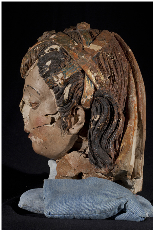
Cabeça de busto relicário, antes do tratamento de conservação e restauro.