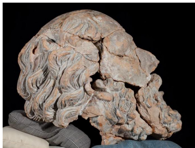
Cabeça de velho antes do tratamento de conservação e restauro.