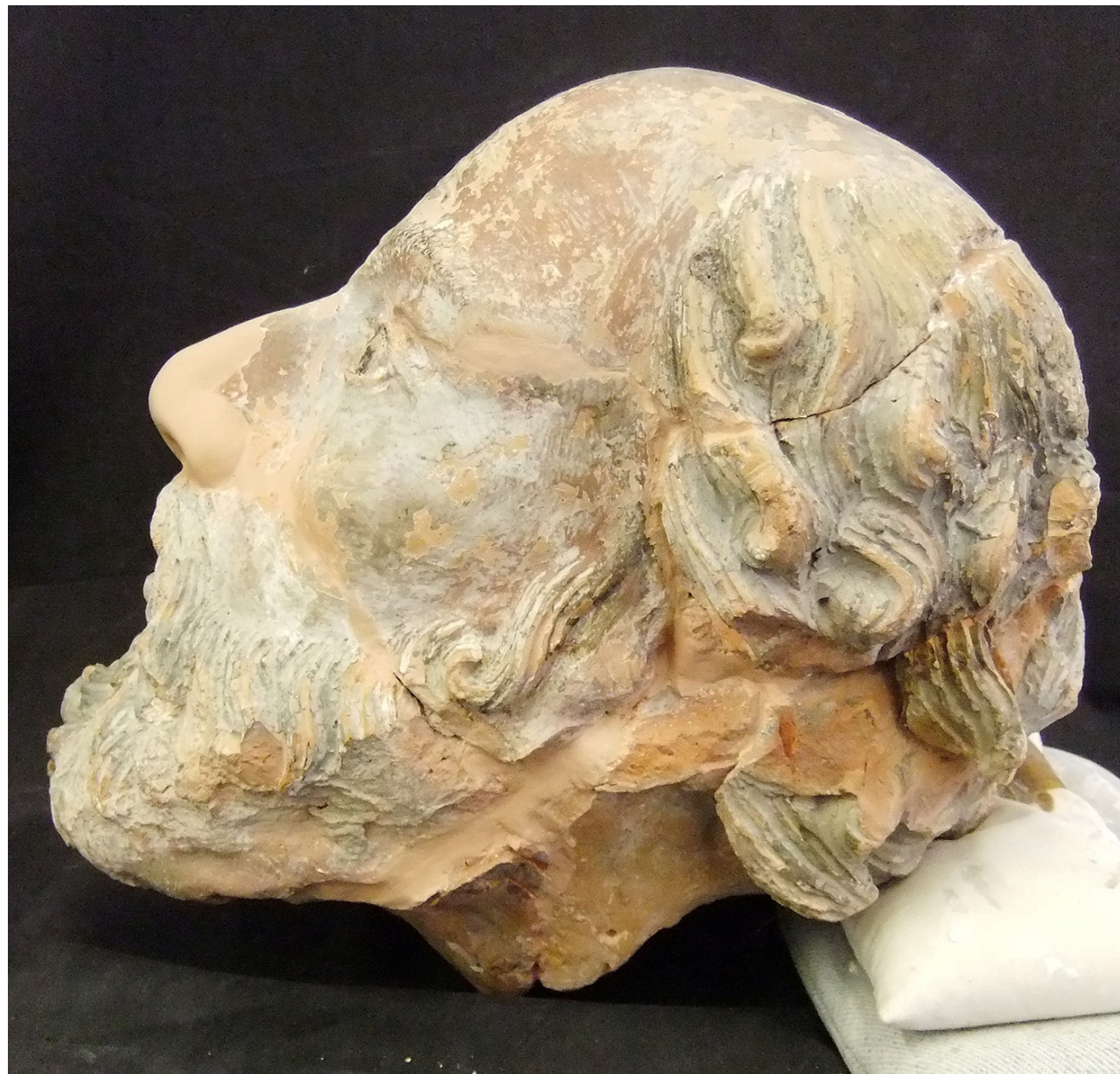
Cabeça de velho após o tratamento .