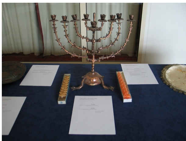
Candelabros, candelabro em exposição e vista da exposição durante o I Congresso Internacional sobre Património Judaico .