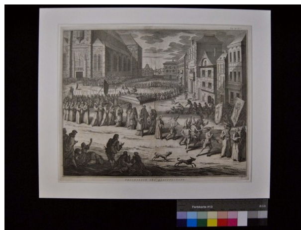
Gravura a talhe-doce Procession des Disciplinans , 1727-38, 335 mm × 416 mm: antes de intervenção de conservação e restauro; durante as acções de limpeza por via húmida; preenchimento de lacunas; após restauro e acondicionamento em passepourtout .