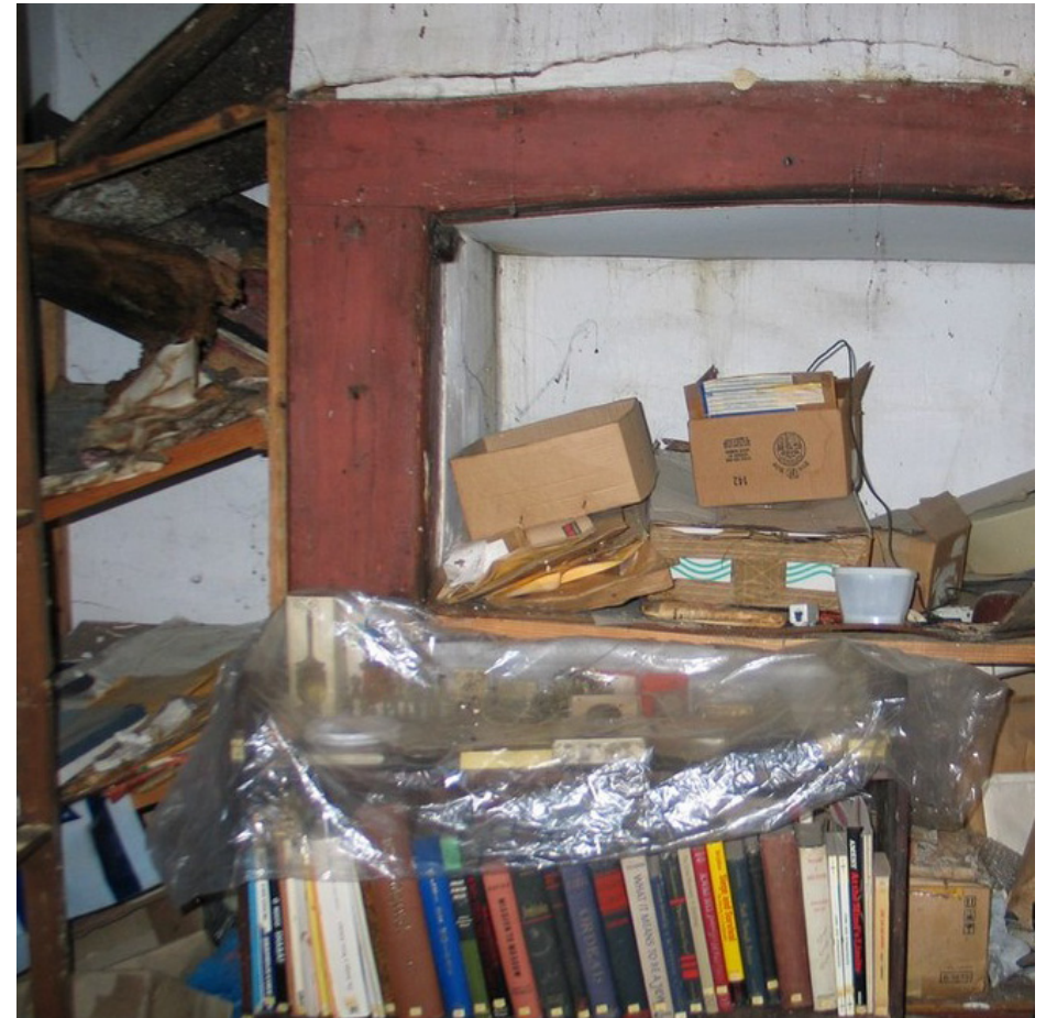
Colecção antes do resgate.

O espólio ficou à guarda da Biblioteca do IPT e em exposição semi-permanente e rotativa desde 19 de Novembro. Uma parte do mesmo esteve patente no Hotel dos Templários, em Tomar, durante o I Congresso Internacional sobre Património Judaico – Ciência, Cultura, Conhecimento .